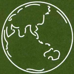
CO 2 排出削減効果

ふ るさと新潟で育った県産材を使うことは森林の循環を促し、 私たちの暮らしを守ることにつながります。