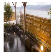
●露天風呂(イメージ)