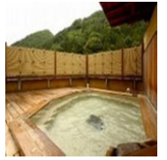
●露天風呂(イメージ)