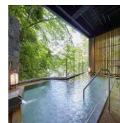
●露天風呂(イメージ)