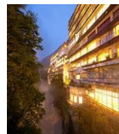
●ホテル外観(イメージ)