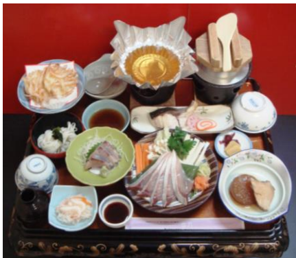
▲鮭づくし御膳(イメージ)